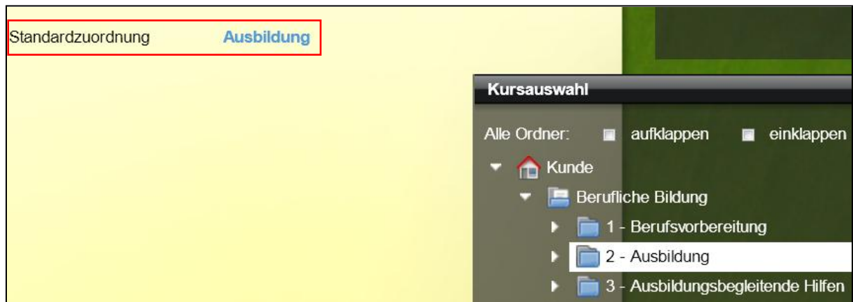
Ausschnitt aus „Kurseditor“

Die Dropdownfelder „Standardzuordnung“ im Kurs- und Ausgabeeditor wurden durch Textlinks, die sich in den anderen Editoren bereits bewährt haben, ersetzt. Neben der Vereinheitlichung konnten wir damit auch einen kleinen Performancegewinn erzielen.